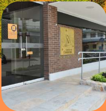
VÍAS DEL NUS